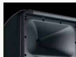
TROMPETA 90 X 60 DE DIRECCIONALIDAD CONSTANTE DE GRAN PRECISIÓN