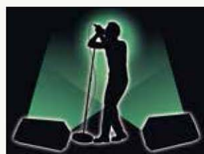
CAJAS SIMÉTRICAS PARA MONITORES DE SUELO EN ESPEJO (DBR12/DBR15)