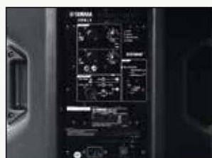
GRAN VERSATILIDAD Y FUNCIONALIDAD (MEZCLADOR DE 2 CANALES CON ENTRADAS XLR, JACK 1/4" Y RCA)