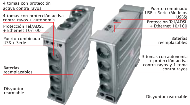
Ellipse ASR 1000/1500

Un conjunto completo (en los modelos USBS se incluyen: cables USB y Serie, software Personal SolutionPac en CD)